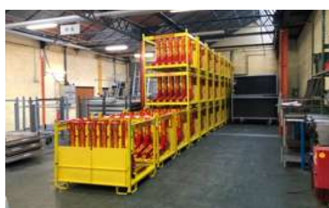
Déploiement et stockage simplifiés

Dimensions - Poids (6modules / vide) : 137 cm x 112 cm x 117 cm - 326/95kg